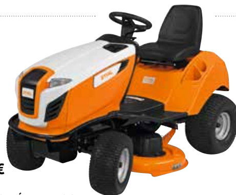
3790€ TONDEUSE AUTOPORTÉE RT 4112 SZ Moteur STIHL EVC 7000. 635 cm 3 . 12.6 kW. Coupe 110 cm. Transmission hydrostatique. Éjection latérale. Hauteur de coupe 35-90 mm. Réglage hauteur de coupe centralisé (450035)