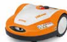
949€ TONDEUSE ROBOT RMI 422 (450015) ✓ Tonte jusqu'à 800 m 2 ✓ Pente jusqu'à 35 % ✓ Capteur de pluie intégré ✓ Système mulching Éco part incluse (3)

Étude de votre terrain et devis d'installation gratuit!