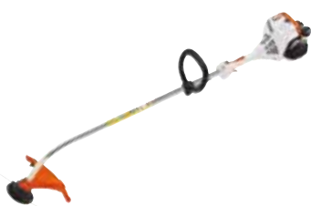
149€ COUPE-HERBES THERMIQUE FS 38 Moteur 2T - 27.2 cm 3 . 650 W. Autocut C 6-2. Léger et maniable. Poids 4.2 kg (923186)