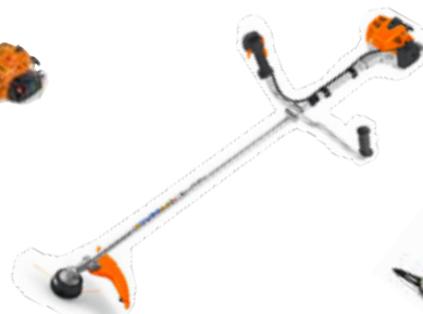
549€ DÉBROUSSAILLEUSE THERMIQUE FS 94 C-E Moteur 2T - 24.1 cm 3 . 900 W. Livrée avec tête Autocut 25-2 et couteau herbes 4 dents. Légère. Démarrage facile ERGO-Start. Harnais double. Poids 4.9 kg (925387)