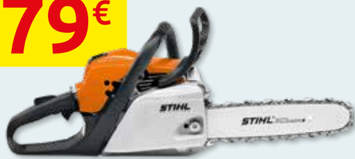
TRONÇONNEUSE THERMIQUE MS 211 35.2 cm 3 . 1.7 kW. Guide de chaîne 40 cm. Système anti-vibrations. Poids 4.3 kg (916508)