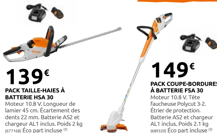
139€ PACK TAILLE-HAIES À BATTERIE HSA 30 Moteur 10.8 V. Longueur de lamier 45 cm. Écartement des dents 22 mm. Batterie AS2 et chargeur AL1 inclus. Poids 2 kg (677168) Éco part incluse (3)