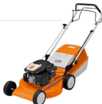
449€ TONDEUSE TRACTÉE RM 253 T Moteur STIHL EVC 200. 139 cm 3 . 2.1 kW. Coupe 51 cm. Carter acier. Bac 55 L. Réglage hauteur de coupe centralisé (450060)