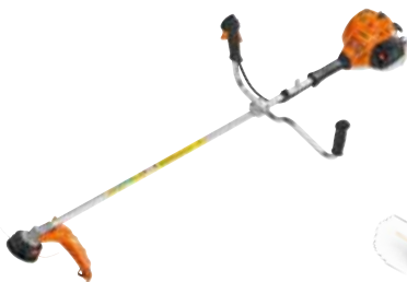
239€ DÉBROUSSAILLEUSE THERMIQUE FS 55 Moteur 2T - 27.2 cm 3 . 750 W. Livrée avec tête Trimcut 31-2 et couteau herbes 8 dents. Démarrage facile avec pompe d'amorçage. Poids 4.9 kg (923187)