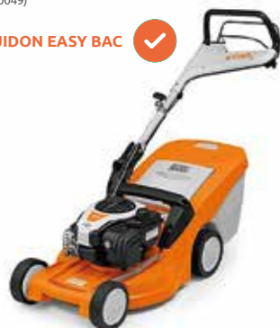
449€ TONDEUSE TRACTÉE RM 448 TC Moteur STIHL EVC 200 C. 139 cm 3 . 2.1 kW. Coupe : 46 cm. Carter en polymère. Bac 55 L. Réglage hauteur de coupe centralisé (450051)