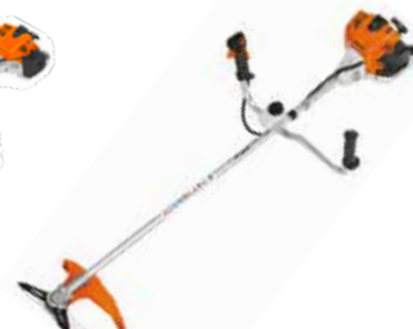
769€ DÉBROUSSAILLEUSE THERMIQUE FS 261 C-E Moteur 2T - 41.6 cm 3 . 2000 W. Puissante et robuste, moteur PRO. Démarrage facile. Harnais grand confort ADVANCE. Poids 7.7 kg (935663)