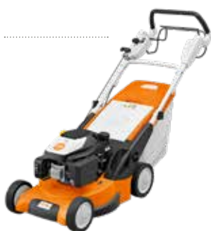
339€ TONDEUSE TRACTÉE RM 248 T Moteur STIHL EVC 200. 139 cm 3 . 2.1 kW. Coupe 46 cm. Carter acier. Bac 55 L. Réglage hauteur de coupe centralisé (450049)