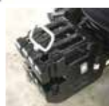
• Masse avant